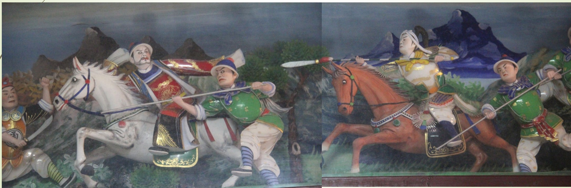
戰潼關 馬超追曹操 葉進祿 作品