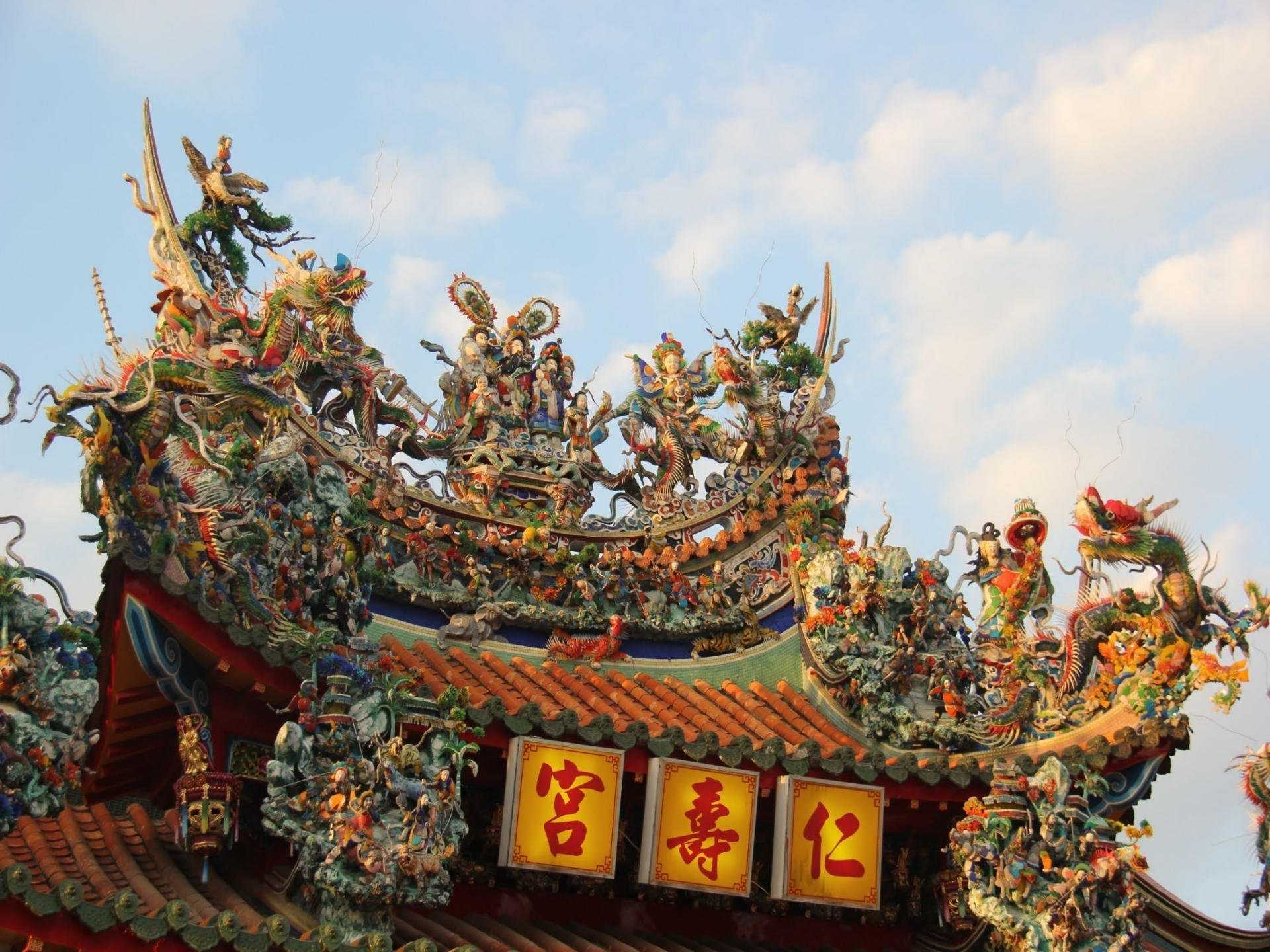
歸仁仁壽宮舊廟頂剪黏