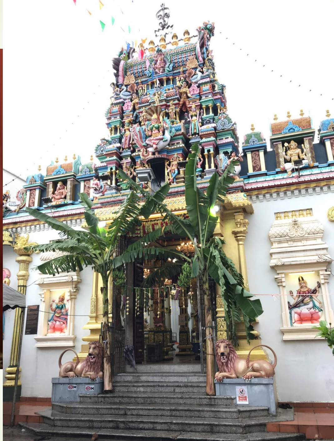
山西雙林寺 檳城寶月庵 印度廟泥塑