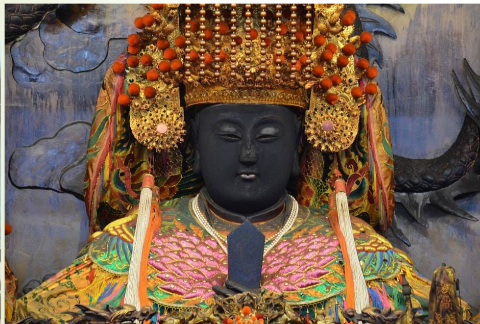
竹溪寺 鹿耳門天后宮 山西宮泥塑