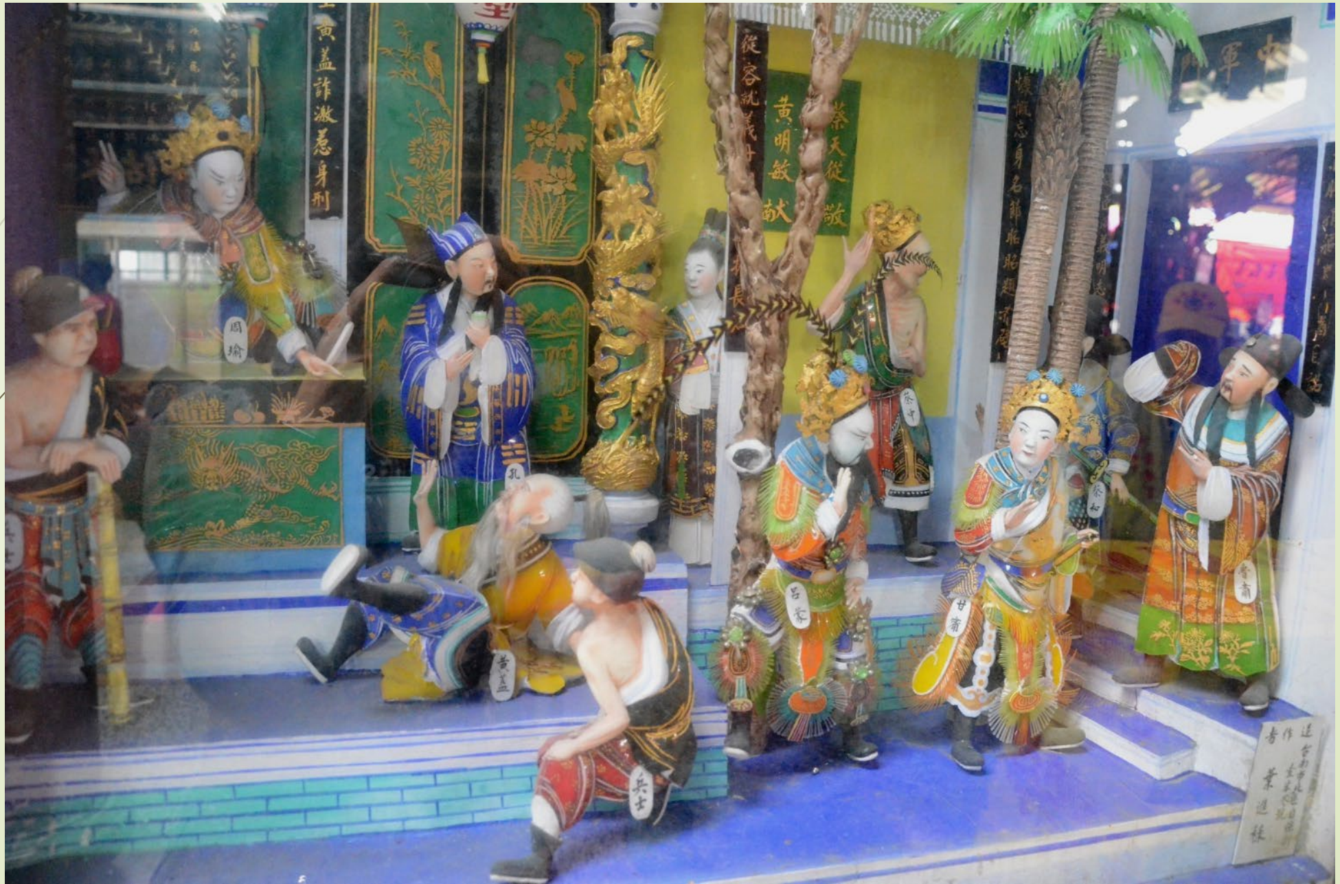
北門永隆宮 葉進祿作品 周瑜打黃蓋