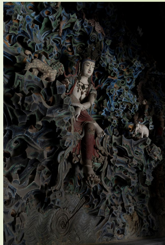
河北正定興隆寺 塑像坐南朝北， 倒坐觀音。 像高3.4米