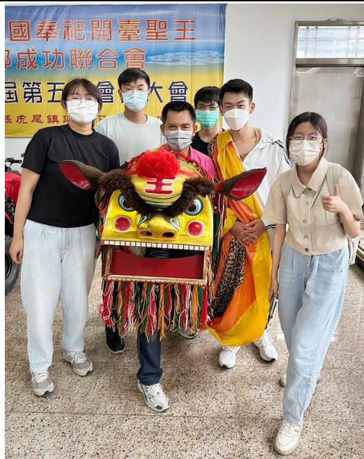
文資系學生前往社區進行獅陣調查合影