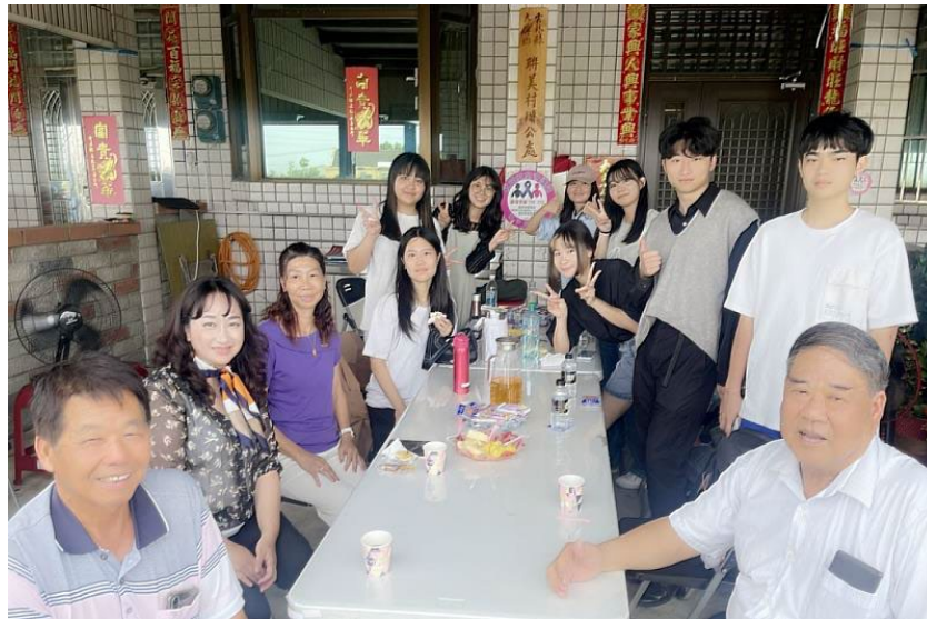
文資系師生至聯美村進行焦點團體訪談情形