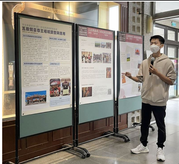
學生進行海報發表之情形