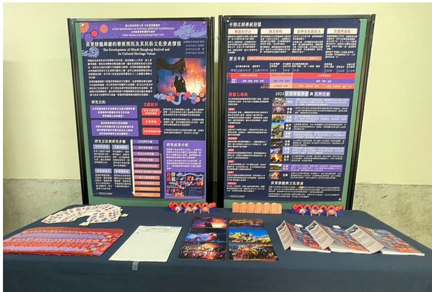
圖 5 文資系 109 級學生實務專題期末展演，學生運用創意為民俗發聲