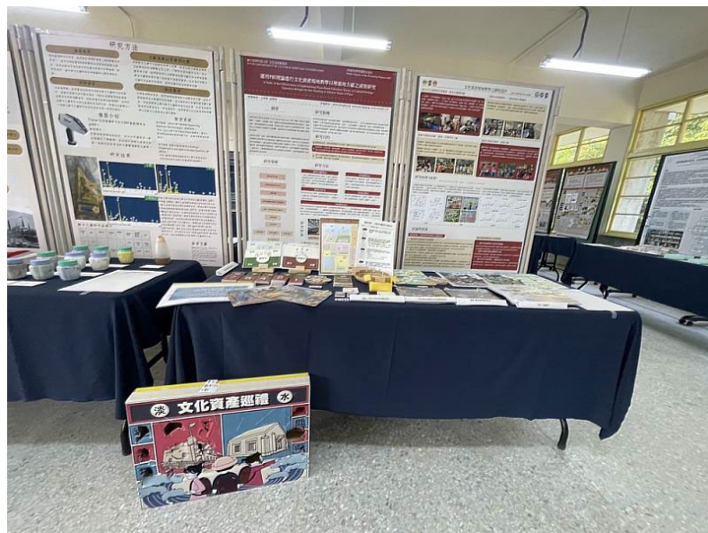
圖 3 文資系 109 級學生實務專題期末展演，展現學生的文資創意