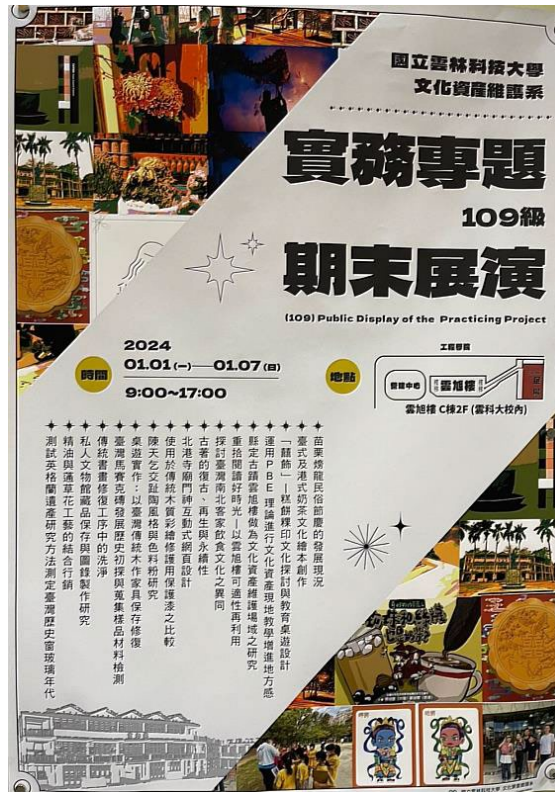
圖 2 文資系 109 級學生實務專題期末展演，研究內容豐富多元