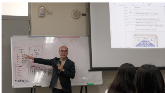
圖 3. 老師向學生講解登錄格式及內容