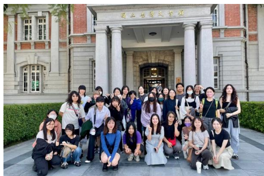
圖 1. 學生參訪國立臺灣文學館