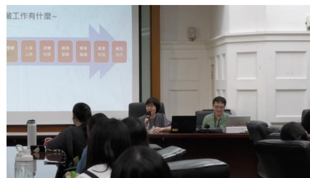
圖 2. 館方人員解答同學預先準備的提問