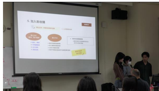
圖 4. 學生介紹徵集與入藏