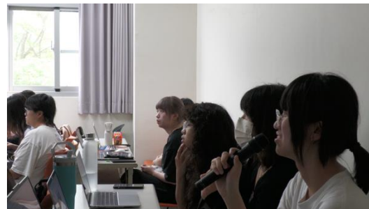
圖 2. 學生回應老師有關登錄單作業問題