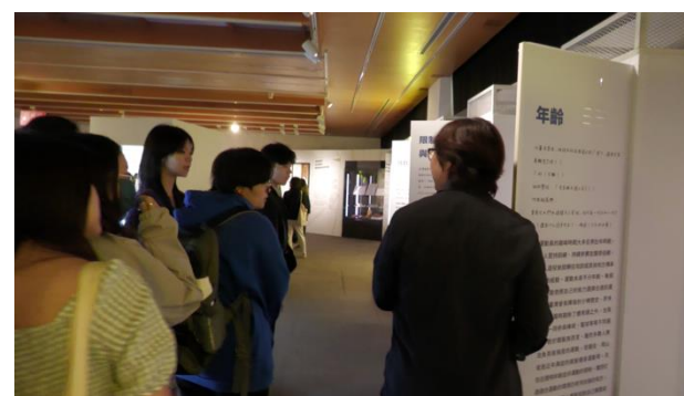
圖 4. 同學參觀「力的多重宇宙——臺灣運動文學特展」