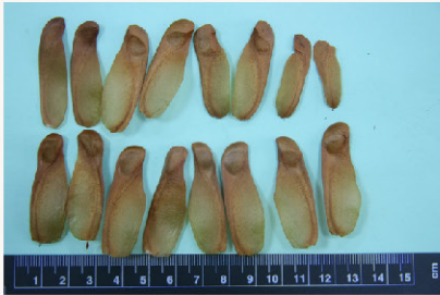
小葉桃花心木 (頂生翅種子)