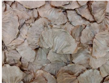
藍花楸 (環生翅種子)