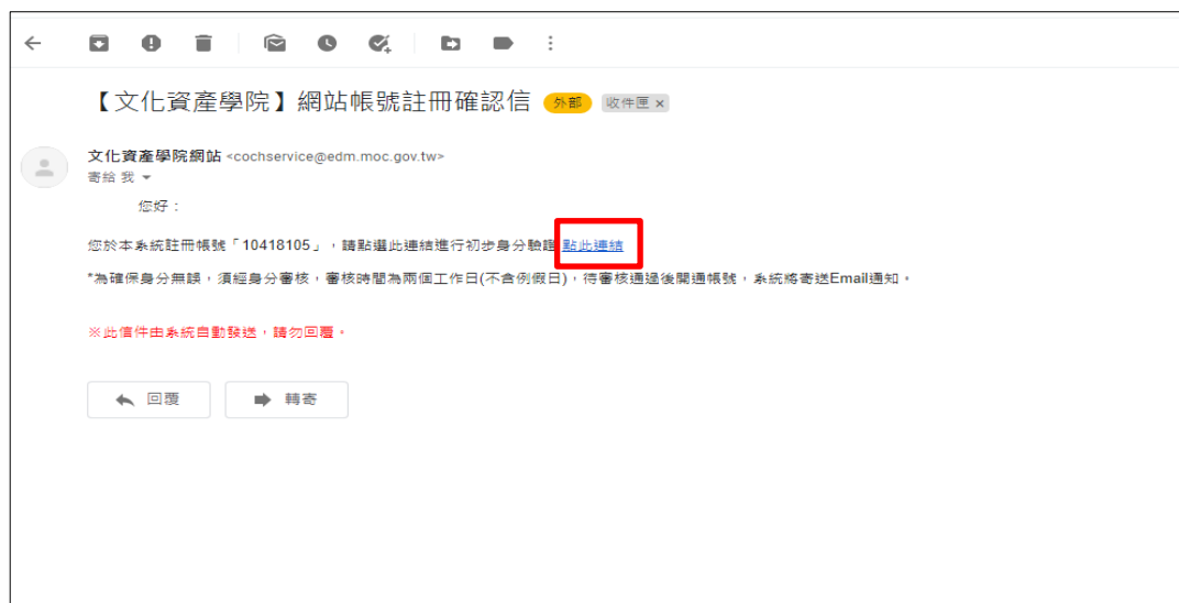
圖 一-2 前往註冊信箱「點此連結」進行初步身分驗證