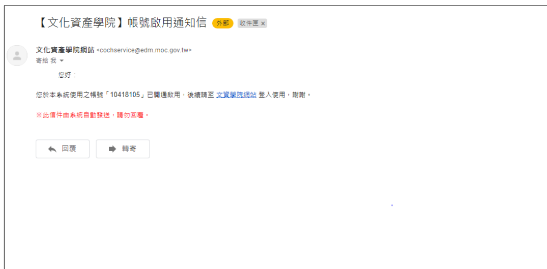
圖 一-3 待審核通過後開通帳號，系統將寄送 email 通知。