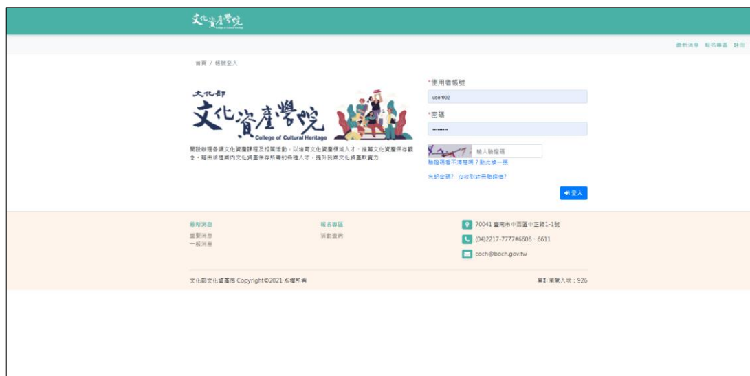
圖 二-1 登入頁面

(一) 個人資料管理可點選右上角(使用者名稱)，進行「編輯個人資料」、「變更電子信箱」與「變更密碼」功能。