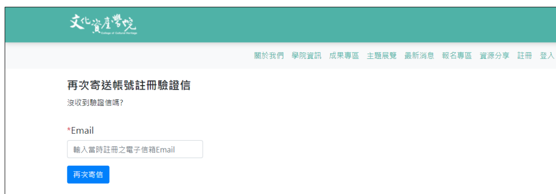
圖 一-5 輸入郵件再次發送註冊驗證信